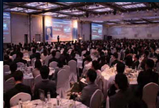
리더스모닝포럼 전경 사진

매달 700명의 리더가 참가하는 비즈니스 세미나, 리더스모닝포럼! 혁신에 필요한 12 주제의 강연을 통해 당신의 삶을 바꿀 지식, 혁신, 통찰력을 배워 가십시오!