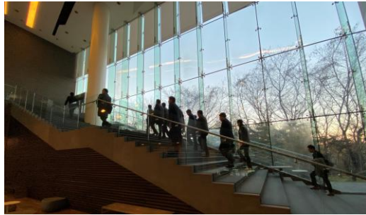
2023, SK아카데미 웨이브빌 방문