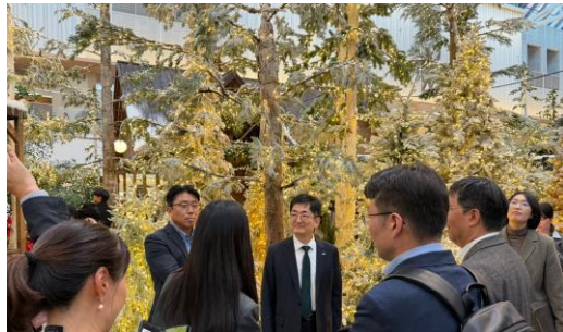
2025, 더현대서울 도슨트 투어