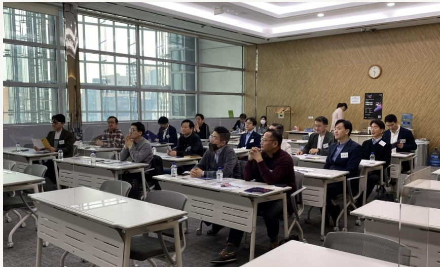
제82회 HRD 부서장교류회 (2023)

HRD 역량 강화를 위한 다양한 진단·자격 과정, 리더십 과정, 팀 조직 강연과 다양한 분야의 트렌드를 전문가를 모시는 트렌드 인사이트 특강을 제공합니다.