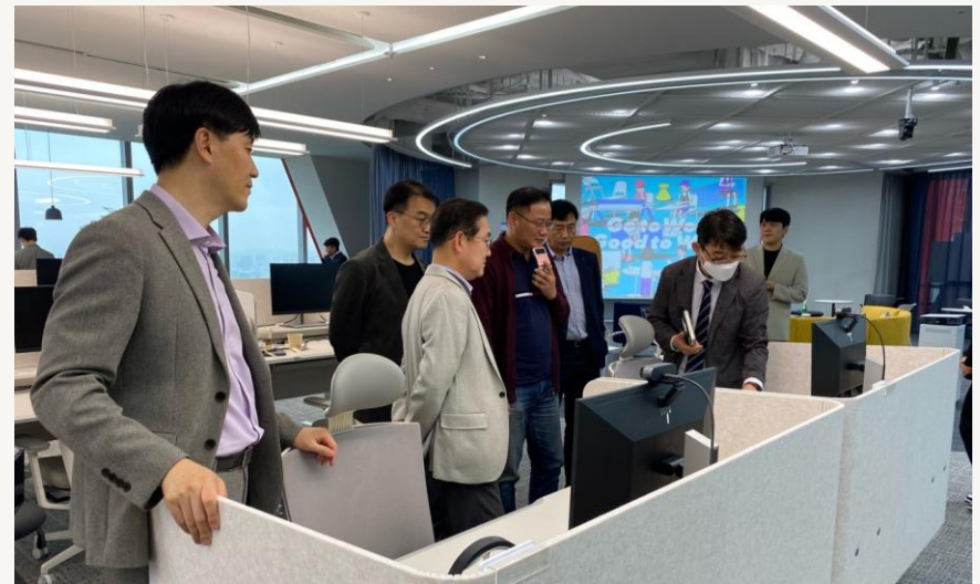
제83회 HRD 부서장교류회 (2023)

요기요의 특별한 조직문화 사례 공유(위대한상상 컬쳐팀 LEAD) + 요기요 오피스 투어 + 조직문화 트렌드 브리핑(KMA조직문화솔루션팀)