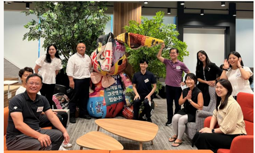
제90회 HRD 부서장교류회 (2024)

'함께하여 더 큰 가치, 자율과 책임을 키우는 PEOPLE 리더십' - 아빈저 경영 연구소 서상태 박사