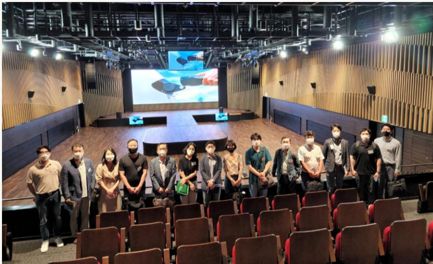
제80회 HRD 부서장교류회 (2022)

기업이나 공공기관의 연수시설을 방문하여 인재 양성을 위한 인프라 구축 현황을 직접 보고 교육 체계를 벤치마킹 할 수 있는 기회를 제공합니다. 기업의 신규 교육 프로그램을 직접 체험하고 리뷰하는 등 HRD 분야의 혁신 사례를 직접 확인해 볼 수 있습니다.