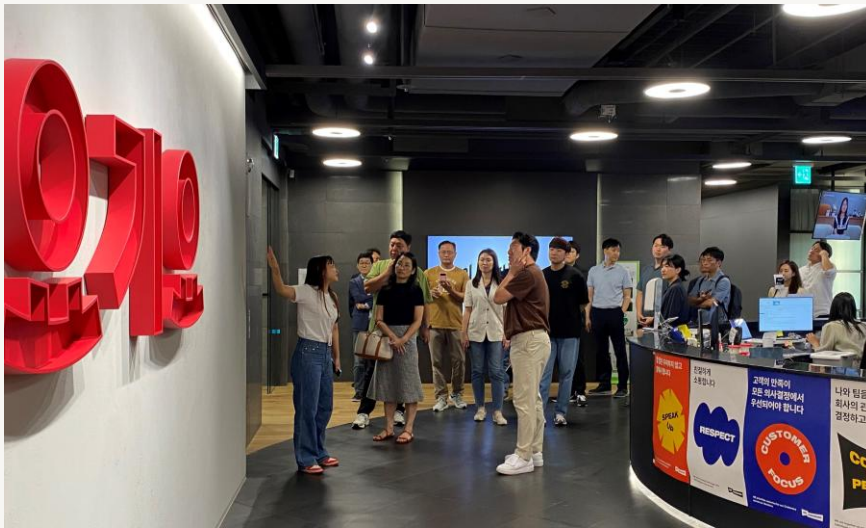
제85회 HRD 부서장교류회 (2023)

HRD 혁신, 새로운 조직 문화 형성 등 우수 사례를 보유한 기업에 방문하여 오피스 공간을 둘러보고 HRD 담당자에게 직접 사례를 들어 볼 수 있습니다. 또한 트렌드를 빠르게 파악하여 연구하고 적용한 기업의 사례를 확인하고 체험해볼 수 있습니다.