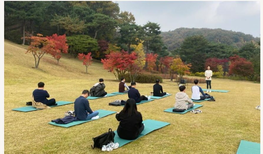
제86회 HRD 부서장교류회 (2023)